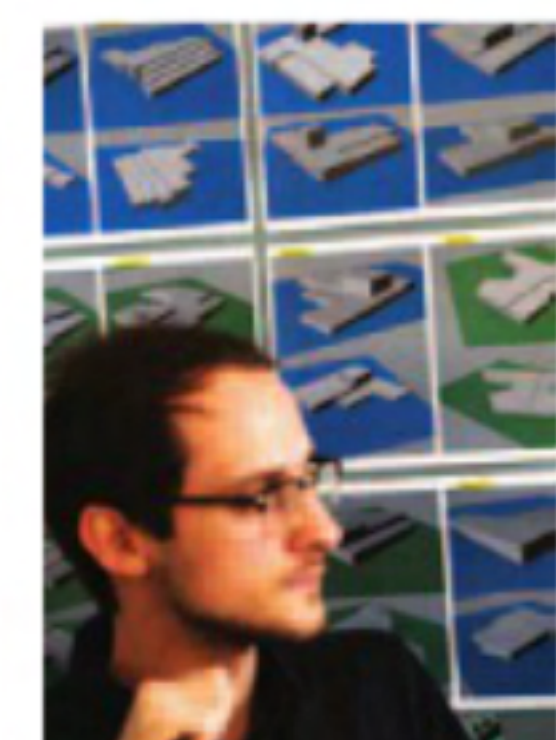
Runt skrivbordet hänger många olika versioner av ett nytt badhus i Kristianstad.

För ett tag sedan var de i Göteborg och träffade badhusexpert och fick höra hur deras ritningar